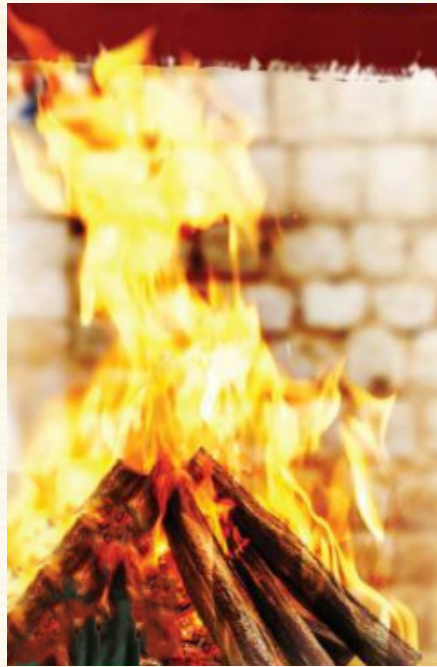
האה"ח הקדוש הדלקה במירונו.

נמצא כמו מסורת עשית ההדלקה היא 'מנהג קדמון' עוד מימי האה"ח הקדוש, והוא בעצמו ערך את ההדלקה, (ולאו דוקא ביום ל"ג בעומר, כפי שמעיד באגרת רבי ישמעאל סאנוויניטי המובאת באגרת האה"ח הקדוש הנדפסים כיום במילואם (הן במהדורת 'מאור' והן במהדורת 'עוז והדר'). שהיה זה בימים שבין פורים לפסח, ואז ערך